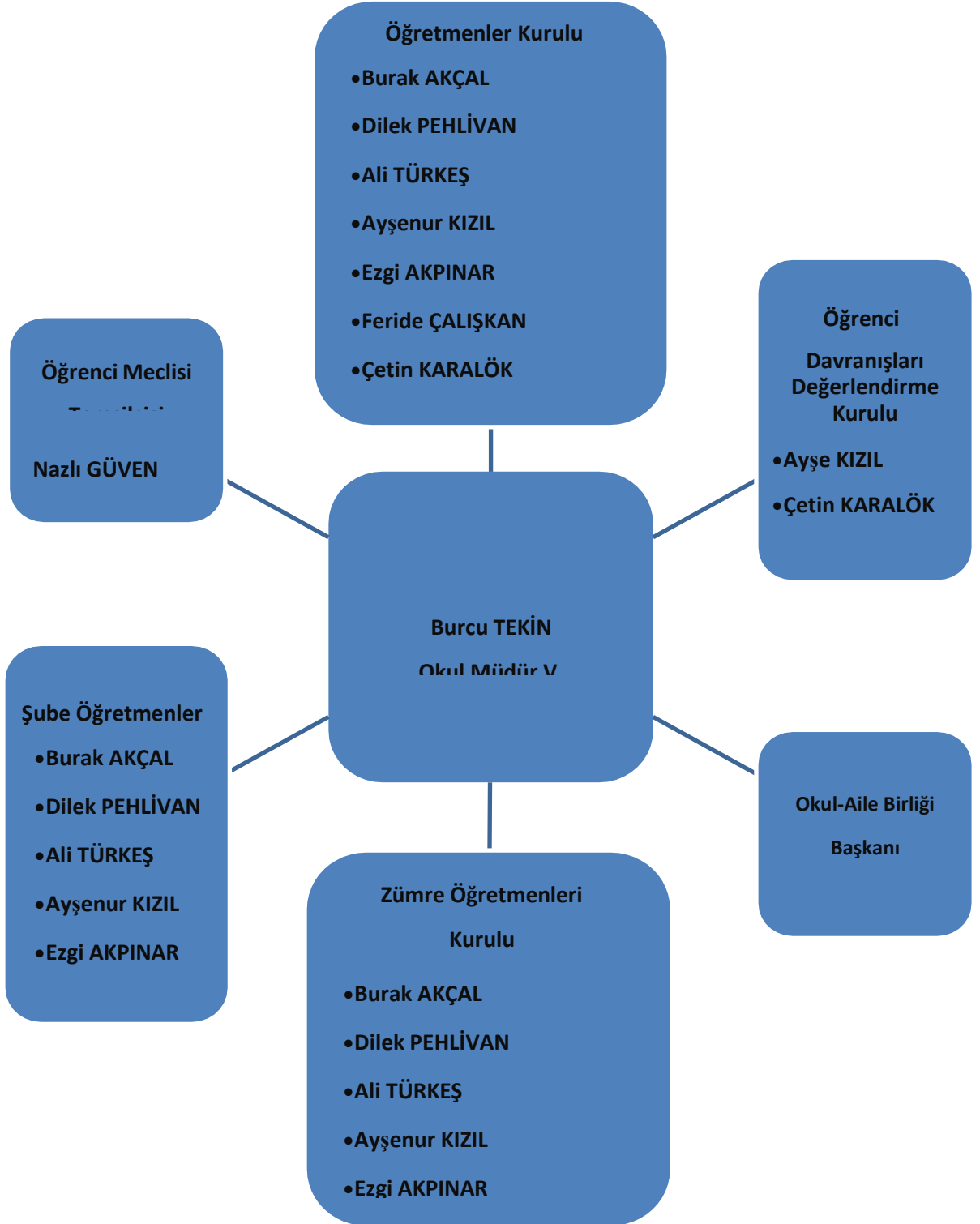
Topçam Şehit Canip Demircan İlkokulu/Topçam Ortaokulu Okul Kuruluş Şeması

Şekil 1:Topçam Şehit Canip Demircan İlkokulu/Topçam Şehit Murat Öndin Ortaokulu Okul Kuruluş Şeması